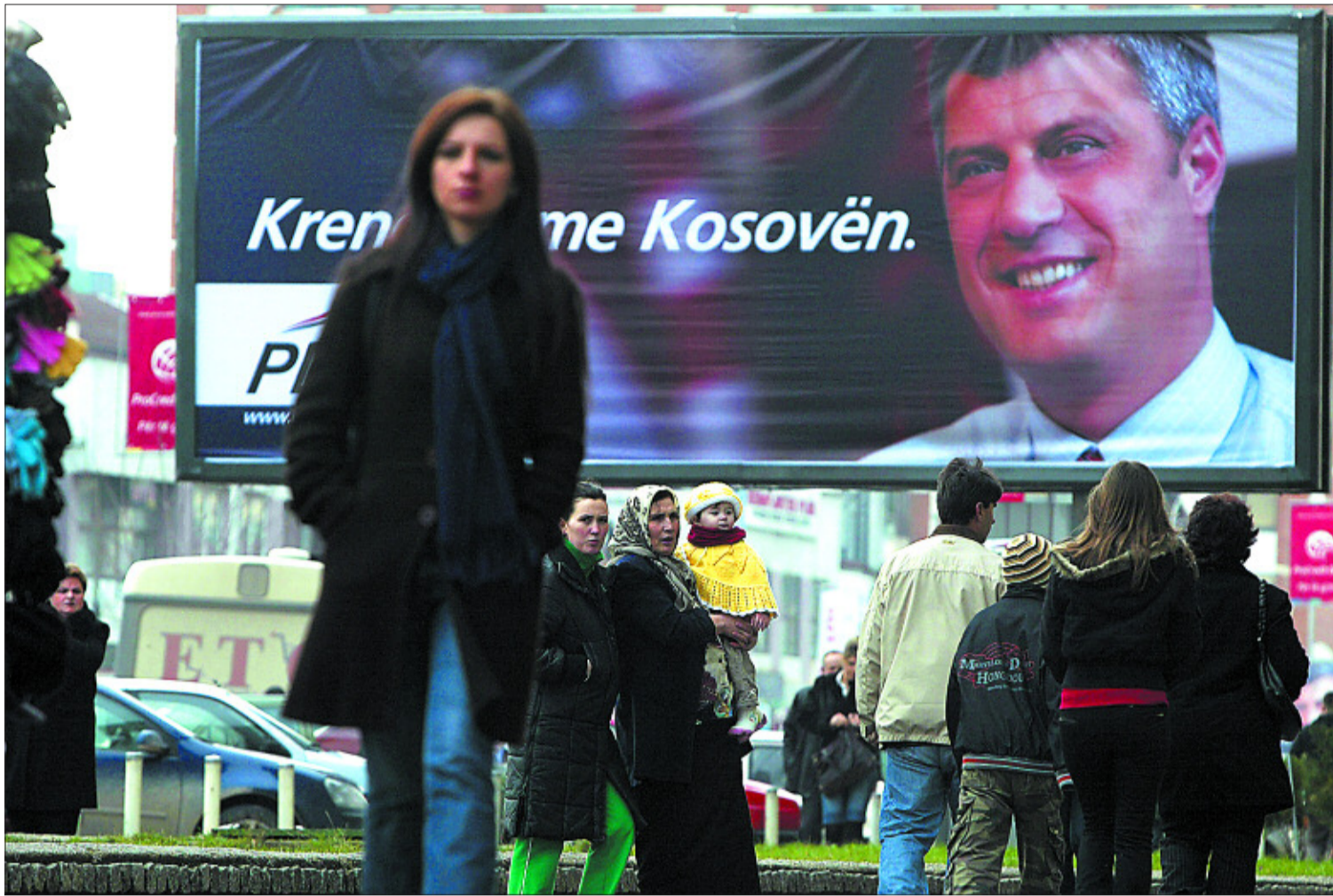
Ciudadanos de Pristina caminan frente a un cartel electoral del Partido Democrático de Kosovo.